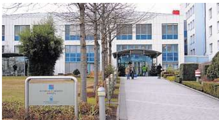
Im Amberger Klinikum wartet man auf das O.K. für eine Kooperation mit Weiden.